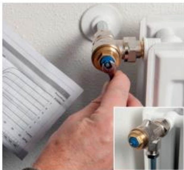
Tabel – volumestroom

De Honeywell-TRV's worden standaard uitgeleverd op stand 6 (110 liter per uur).